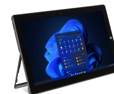
Tipcover optional erhältlich